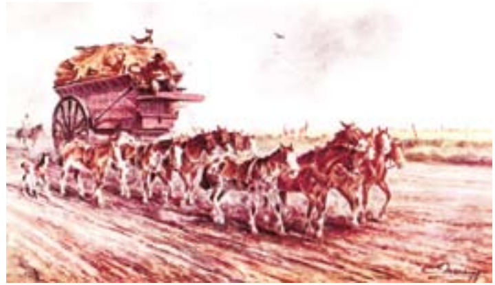
Veinte caballos al pecho y en las cuartas arrastran a este navío de la pampa, que transporta mercaderías y frutos del país. Pintura del argentino Eleodoro Marengo.

También los culateros fueron una invención nuestra. En las bajadas muy pronunciadas, el freno del carro y el caballo varero no podían frenar tal peso. En dicha circunstancia, los culateros –generalmente dos– eran enganchados en la parte trasera, en contra de la dirección de marcha, evitando posibles problemas.