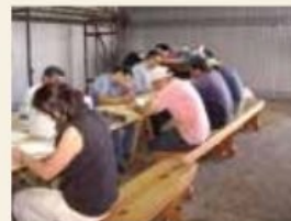
Algunos de los alumnos dando su examen escrito.