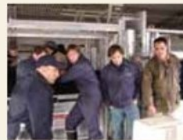
Novatos y experimentados practicando.