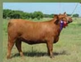
Reservado Campo Ternero Mayor individual Exposición de Primavera 2011