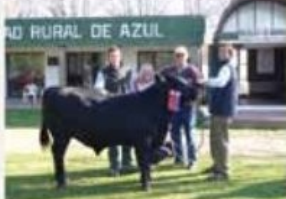
Reservado Campo Ternero Menor individual Exposición Nacional del Ternero, Azul 2010

Nuestro PROGRAMA GENÉTICO y la MEDICIÓN DE DATOS PRODUCTIVOS permanentes aseguran la rusticidad, calidad y fertilidad de nuestros reproductores.