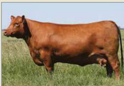
5839, su madre.

Padre: S A V 004 DENSITY 4336 SITZ TRAVELER 8180 S A V 8180 TRAVELER 004 BOYD FOREVER LADY 8003 LEACHMAN RIGHT TIME S A V MAY 7238 S A R PROSPECTOR MAY 9124 Madre: RUBETA 5839 CHAMPION HILL TECUMSEH RUBETA 4444 QUEBRANTADOR-T/E- TRES MARIAS 6700 QUEBRA 5854 PASTORIZA 565 BRIGADIER -T/E- TRES MARIAS 7952 BRIGADIER 6694-T/E- TRES MARIAS 6694 EMILIA 6302