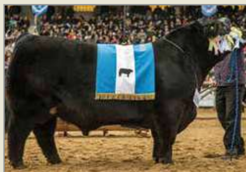
Federal. Propio hermano de su madre.