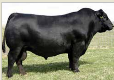
Networth, su abuelo.