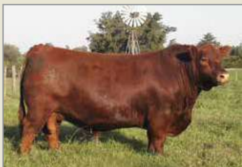
Quebrantador, su padre.

Impactante padre colorado recomendado para vaquillonas de 20 meses. Nada menos que Quebrantador sobre Brigadier en la inigualable 7952 (madre de Franco). Mucha clase, musculo, hueso y arco costal en este hijo e la 7952 el cual se destaca por su corrección y su facilidad de engorde.