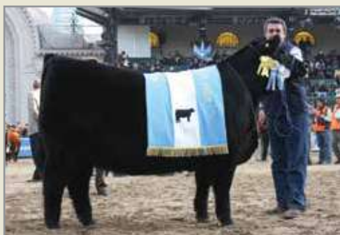
Areia, Propia hermana de su madre

A tención a este torazo, Pegual es sin lugar a dudas, otro de los machos más importantes de esta venta. Hijo directo de Menta (propia hermana de dos grandes campeones de Palermo, Areia y Federal) y padre Candelerero. Sus números son altamente destacables observándose en ellos su circunferencia escrotal en el 20% superior de la raza como su AOB de +2.4 15% superior de la misma. En definitiva lo tiene todo, pedigree, números y un fenotipo realmente de excepción