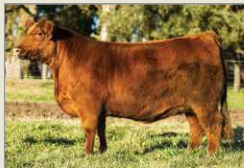
La 100, su madre.