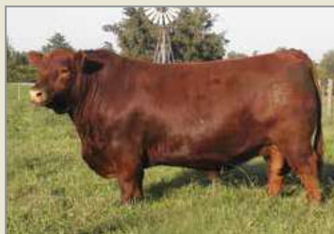
Quebrantador, su abuelo.