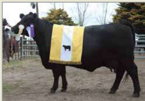
Su madre Polonia 3er Mejor Hembra Primavera 2013