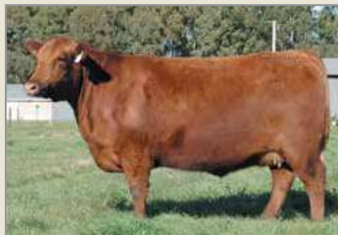
Angie, su abuela.