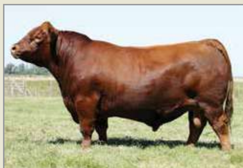
Franco, su padre.

E xcelente vaquillona colorada hija de Franco y perteneciente a la familia de las legendarias Panteras de Cochicos. Posee un excelente arco de costilla, muy buen hueso, cuartos bien descendidos, mucha carne y una gran feminidad. Todas sus características propias sumadas al peso específico de su Pedigree, harán seguramente de Mostaza otra de las atracciones de esta venta.