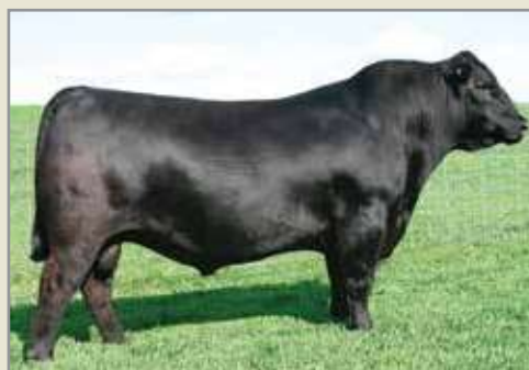
Bismarck, su padre.