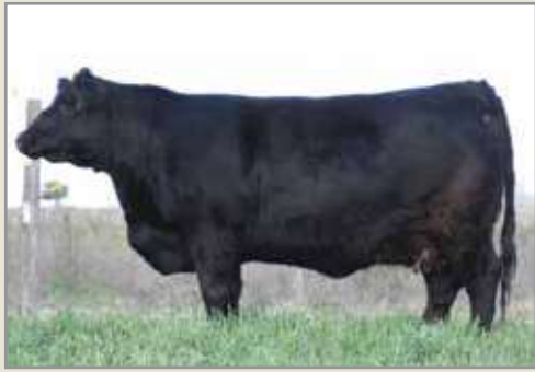
Mónica, su madre.