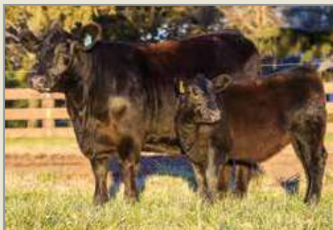
Polonia, su madre.

S A V 8180 TRAVELER 004 S A V NET WORTH 4200 S A V MAY 2410 Madre: CIBUS 300 POLONIA-NET-416-T/E- O C C ANCHOR 771A SURANGUS BLACKCAP 0416-T/E- LEACHMAN BLACKCAP 1111