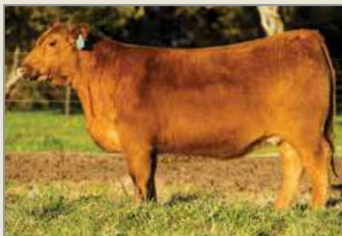
Panfila, su madre.

Atencion a los números de Cándida, los cuales acompañados de su gran calidad racial, gran arco de costilla, muy buen hueso, mucho musculo y excelente feminidad hacen de ella una verdadera oportunidad para fundar una familia de colorados de bajo peso al nacimiento.