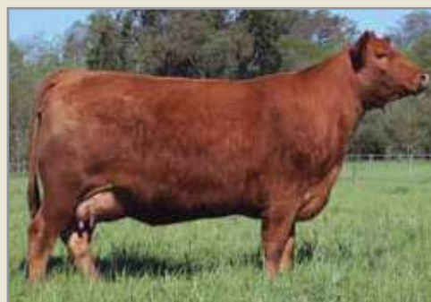
7952, su madre.