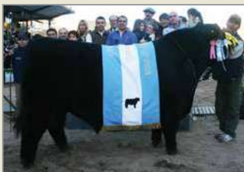
Vidente, su padre.