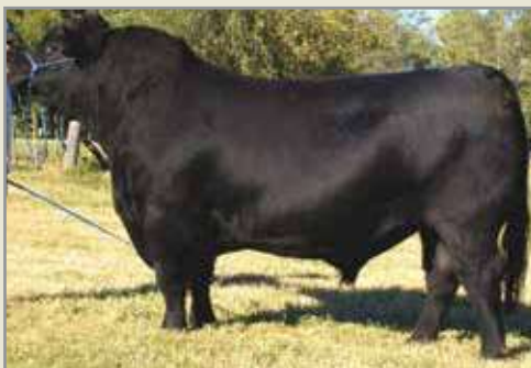
Candelerero, su padre.

E xcelente fenotipo y calidad racial en este hijo de Candelerero y perteneciente a través de su madre a la gran familia de la legendaria Gringa. Un padre realmente destacable a la hora de analizar estructura, largo, arco de costilla, cabeza, línea inferior y ancho. En definitiva un padre para incorporar a los rodeos más exigentes.