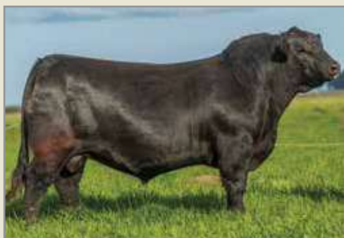
Bravo, su padre.

G A R US PREMIUM BEEF PRIMAVERA 9714 01028 P BEEF-T/E- BEST 1028 DISCOVERY -T/E-