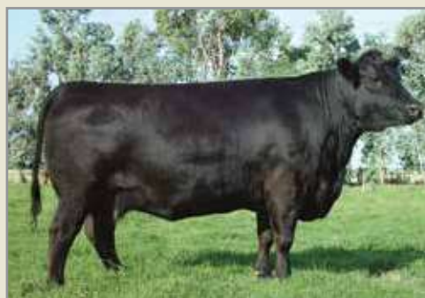
Gringa, su abuela.