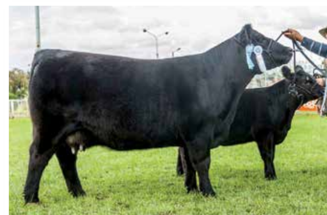
Tercer Mejor Individual Otoño 2018.