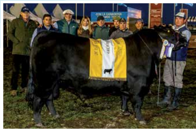
Tercer Mejor Macho Nacional 2017.