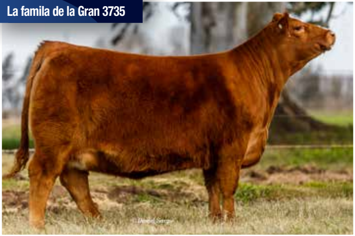
PUCARÁ La familia de la Gran 3735

Halcón - Waka Waka - Sakic - Federica. Respaldo genético y pedigree abierto con Waka Waka y Federica.