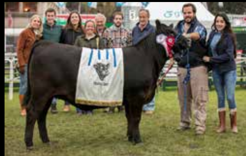
Res. Gran Campeón Hembra - Expo Prado 2017