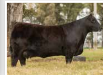
Silvia, 2ª madre del año, su famosa hermana.