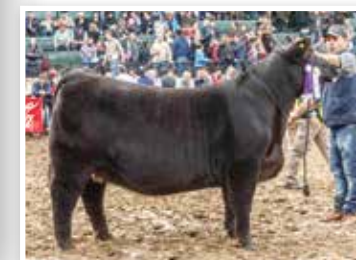
Patagonica, su propia hermana y la muy comentada Res. Campeona Vaquillona.