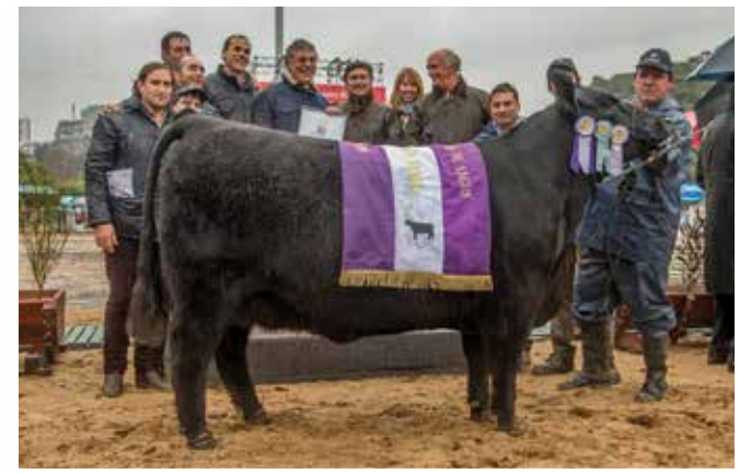
Reservada Gran Campeona Palermo 2015