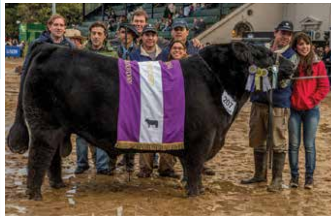
Reservado Gran Campeón Palermo 2015.