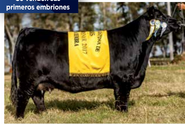
BONITA (0788) Tercer Mejor Hembra de Otoño 2017. Crédito por Mercachifle 36, sus dos primeras hijas ya son donantes en Los Murmullos.