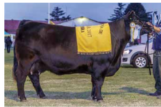
Tercer Mejor Hembra Otoño 2017.