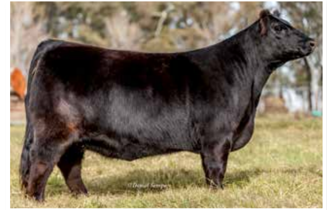
LUCRECIA (0707) Cóndor x Silvia x Crédito x Apampado 96.