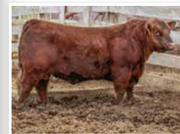
Reckoning, hermano paterno de estos embriones.