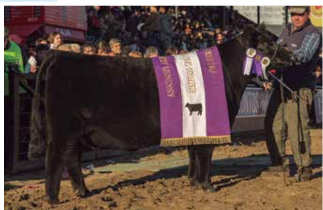
Reservado Gran Campeona Palermo 2014.