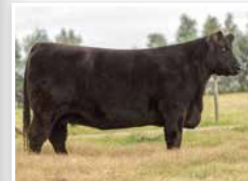
Apampado 96 "Madre del año". Su madre.