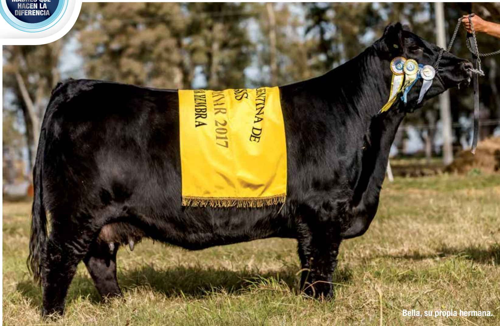
Bella, su propia hermana.

Por primera vez ofrecemos embriones de esta nueva integrante de las Mercachifles, la 172, hermana de Patagonia, propia hermana de Bonita, Patagónica y la 230.