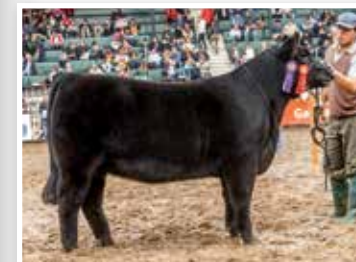
Su propia hermana Res. Campeón Ternera Mayor Palermo 2017.