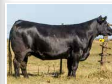
La Juanita 230 Patagonia Propia hermana.