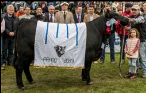
Gran Campeón Hembra - Expo Prado 2017

Estamos orgullosos de formar parte de los equipos de trabajo que lograron los mas altos méritos en las pistas y en el campo.