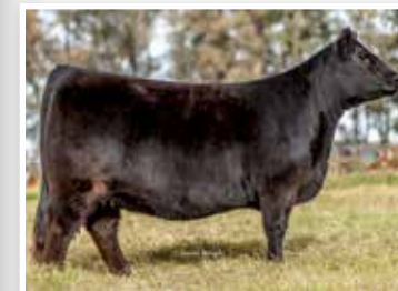
Caro, su excepcional madre.