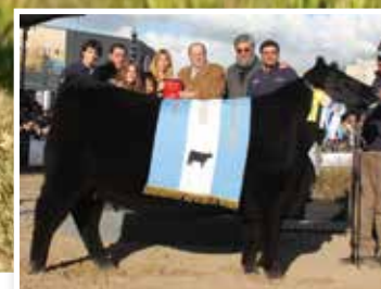
Propia hermana, Gran Campeona de Palermo.