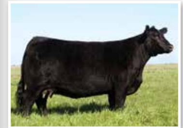
Foto de campo de la gran Forjadora 5876, madre de estos embriones.