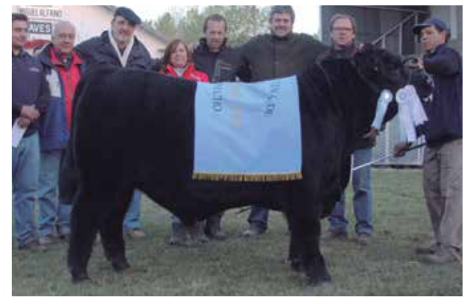
Gran Campeón Otoño 2013. Hijo de una vaca de Los Murmullos.