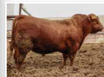
Recon, padre de los embriones