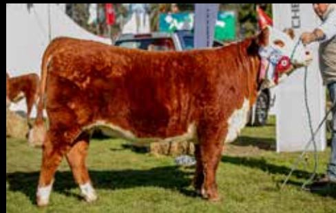
Res. Gran Campeón Hembra - Expo Prado 2017