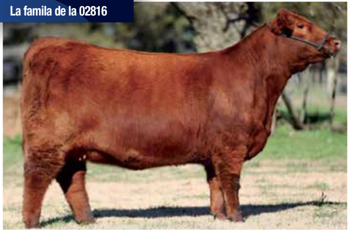
KATE La familia de la 02816

Daktari-8850-Yesquero-5854-. La gran familia de la Kate y con el respaldo de la 5854 y 02826. Su madre hermana de la 6700, madre de Quebrantador y de Vicky.