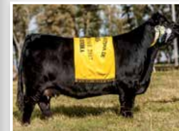
Bonita, hija de su propia hermana.