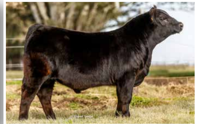
Segunda Elección parición 2017.

Invierta en un padre con gran respaldo genético. Le ofrecemos compartir el mejor ternero nacido en Los Murmullos en 2018. Compitamos juntos en las exposiciones y luego un padre superior.