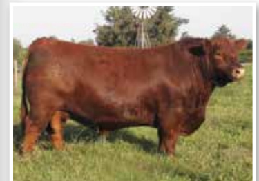
Quebrantador, hijo de la propia hermana de su madre.