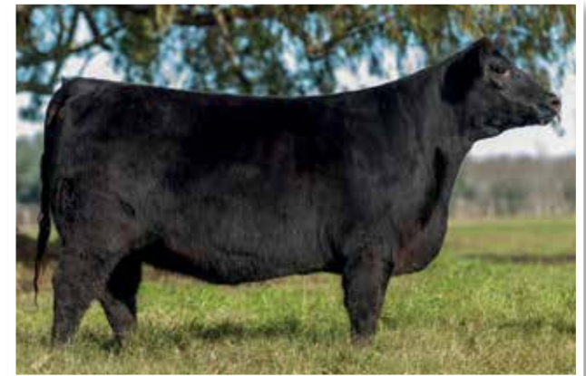
PAMPEANA (0533) Zorzal x Apampado 96.