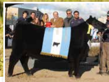
Propia hermana, Gran Campeona de Palermo.