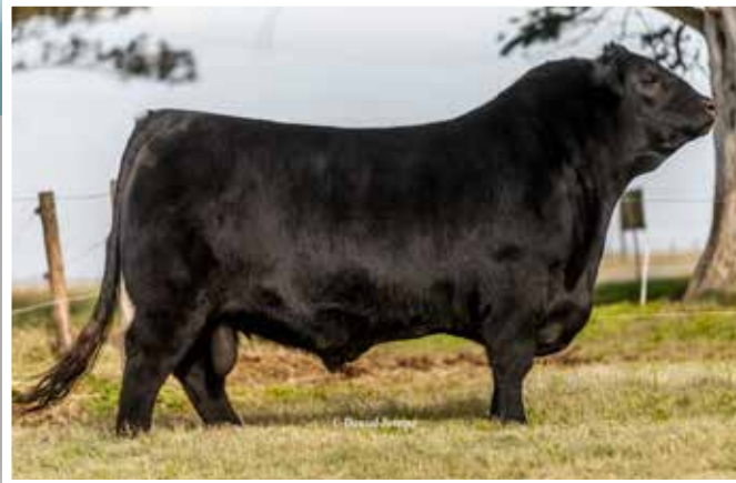
Milo, 3 er Mejor Macho Nacional 2017 y 3er Mejor Ternero de la Exposición Palermo 2016.