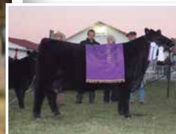
Su madre, la gran 0421.