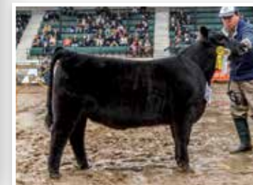
La 240 como 1º Premio y 3º Mejor Ternera Menor Palermo 2017.