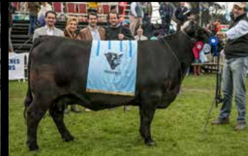
Tercer Mejor Hembra - Expo Prado 2017