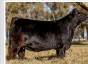
Esperanza, su gran madre.