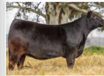
Luna, su destacada madre e hija de Silvia.