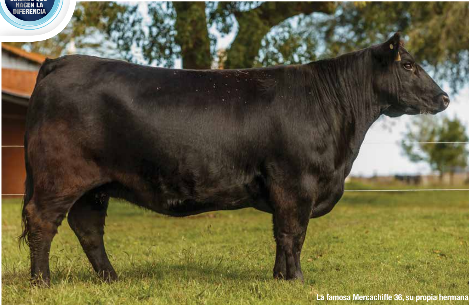
La famosa Mercachifle 36, su propia hermana.

Otra joya!! Una nueva Mercachifle que entra al mercado. Nada menos que la Mercachifle 24, la propia hermana de la Mercachifle 36. Invierta en una gran familia.