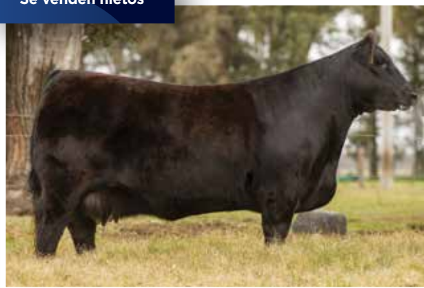
SILVIA (0331) “Por 2ª vez Madre del Año” y de la Gran Campeona de Palermo 2017.