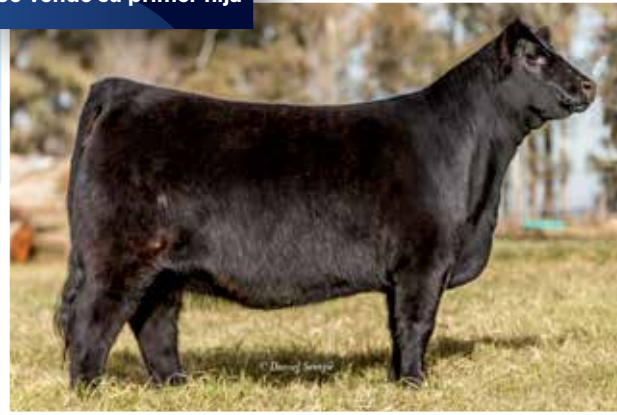
SOÑADITA (114) Candelero x Soñada x Density x 674. Tercer Mejor Individual Otoño 2018.