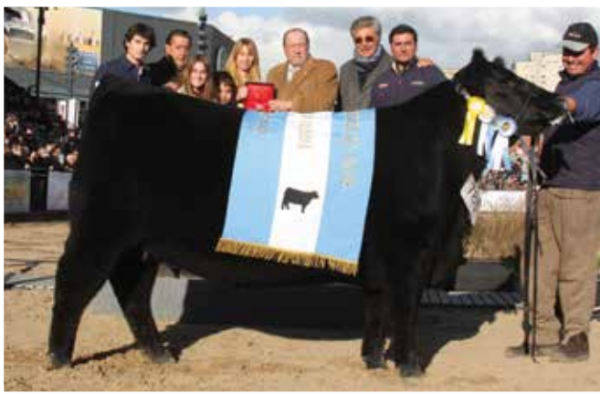
Gran Campeona Palermo 2012.