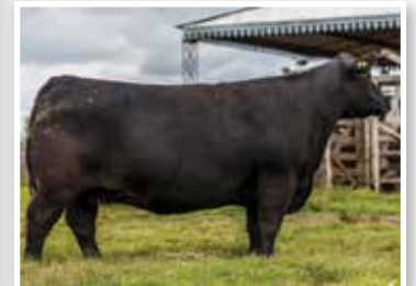
La famosa 436 de La Juanita, su propia hermana.