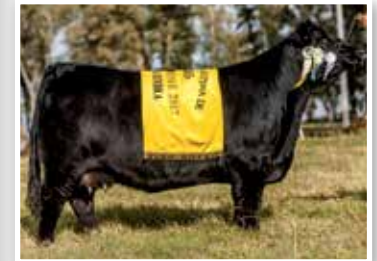
Bonita, hija de su propia hermana.