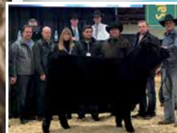
Su hermana, vendida en precio máximo en Canadá.