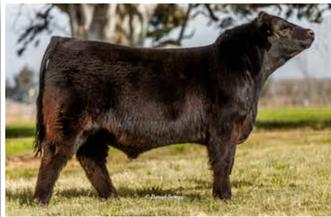
Primera Elección parición 2017.