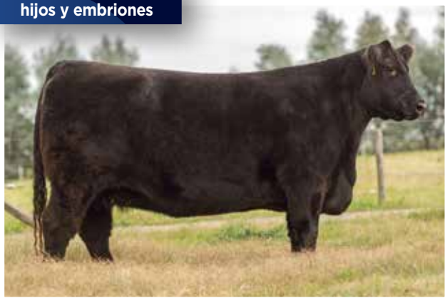
APAMPADO 96 (96) “Madre del Año” y de grandes campeones, incluido Palermo.

Se venden varias hijas, hijos y embriones