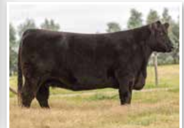
Apampado 96, madre del año y su abuela.