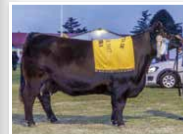
Soñadita, su madre 3 er Mejor Hembra Individual Otoño 2018.