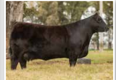
Silvia, su famosa madre, 2ª Made del Año 2017.