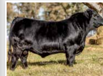
Carlitos, de la fila de Palermo de Los Murmullos, su hijo.