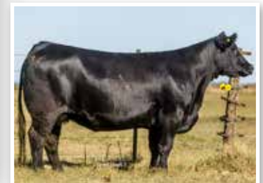
La Juanita 230 Patagonia, hija de su propia hermana.