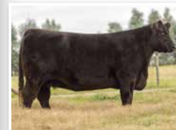
Apampado 96, madre del año y de estos embriones.