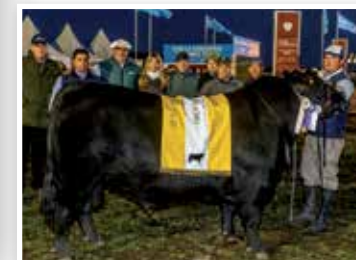
Su propio hermano, 3º Mejor Macho Nacional 2017.