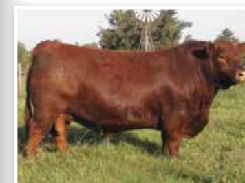
Quebrantador, hijo de la propia hermana de su madre.