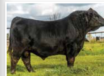
Su propio hermano, una de las atracciones en el remate La Juanita 2018.