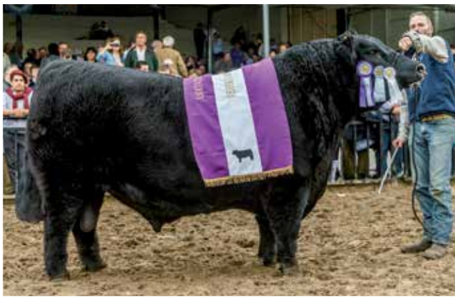
Reservado Gran Campeón Palermo 2017. Hijo de una vaca vendida en el remate de Los Murmullos.