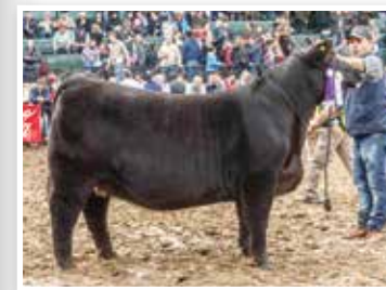
Patagonica, su propia hermana y la muy comentada Res. Campeona Vaquillona.