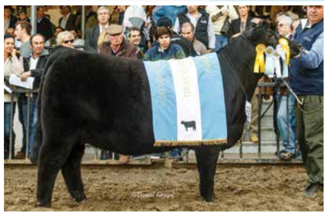
Gran Campeona Palermo 2017.