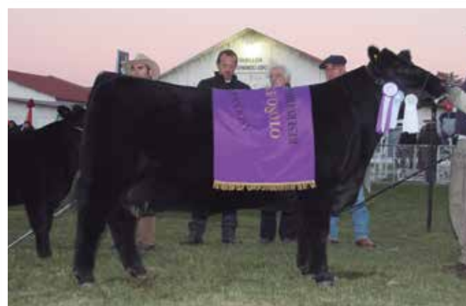
Reservado Gran Campeona Otoño 2013.