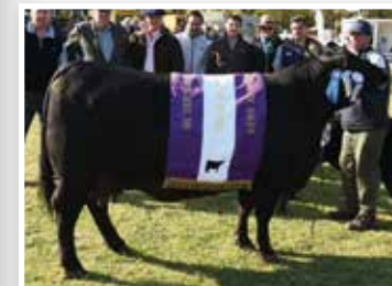
Su madre Res. Gran Campeona Nacional 2016.