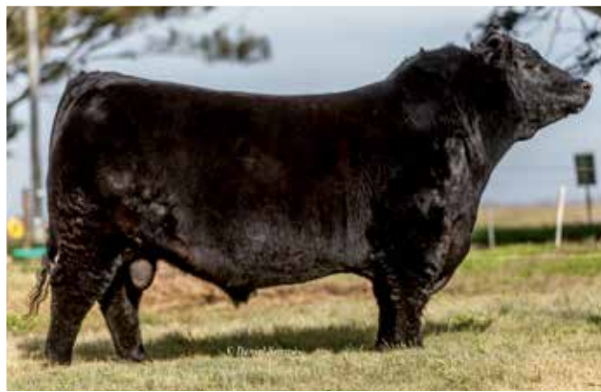
Lolo, 3 er Mejor Dos Años Menor Palermo 2017.