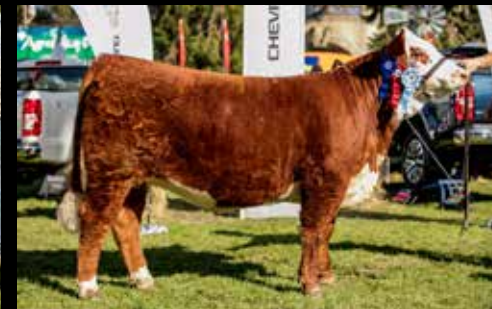
Tercer Mejor Hembra - Expo Prado 2017

No requiere estimulación hormonal Producción de embriones sexados Aspiración a partir de los 10-12 meses de edad