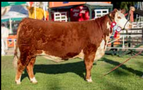
Gran Campeón Hembra - Expo Prado 2017