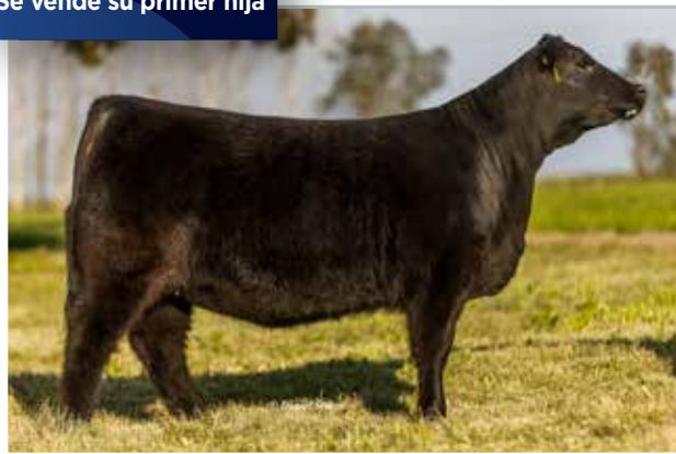
BELLA (0174) Maxi x Bonita x Crédito x Mercachifle 36.