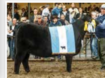
Matilda, Gran Campeona Hembra Palermo 2017 y hermana de su madre.