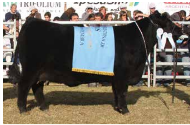
Gran Campeona Otoño 2011.