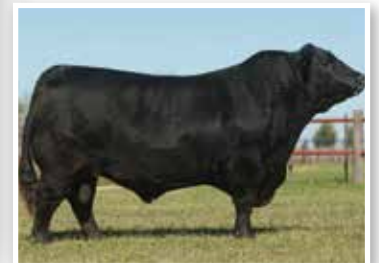
Baco, Bi Gran Campeón Nacional y propio hermano.