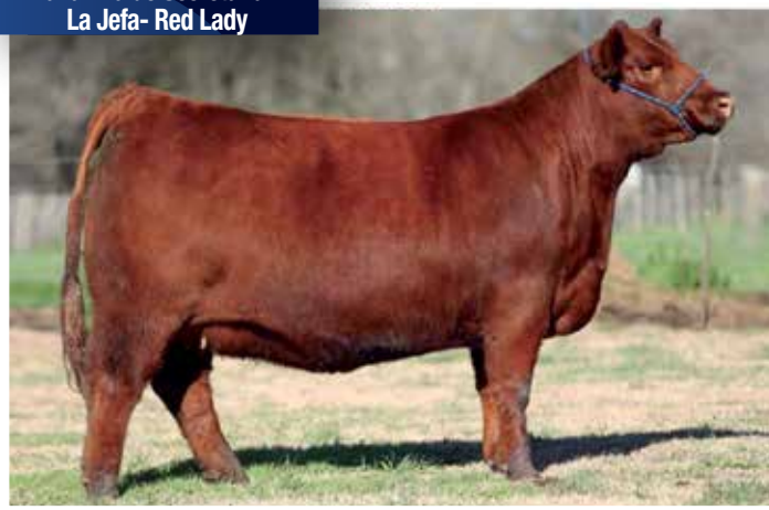
SECRETARIA La familia de Secretaria - La Jefa- Red Lady

Halcón - Waka Waka - Sakic - Federica. Respaldo genético y pedigree abierto con Waka Waka y Federica.