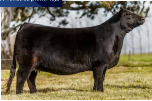
CARO (0709) Cóndor x Silvia x Crédito x Apampado 96.